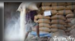
ห้าแสนล้าน