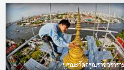
บูรณะวัดอรุณราชวราราม

ภาพข่าวในหนังสือพิมพ์บางกอกโพสต์และโพสต์ทูเดย์ได้รับ 5 รางวัลอันทรงเกียรติจากสมาคมช่างภาพสื่อมวลชนแห่งประเทศไทย โดยบางกอกโพสต์ได้รับ 3 รางวัล ได้แก่ รางวัลรองชนะเลิศในประเภทภาพข่าวเศรษฐกิจ จากภาพ “สปาหอยทาก” รางวัลชมเชยในประเภทภาพข่าวเศรษฐกิจ จากภาพ “ห้าแสนล้าน” และรางวัลชมเชยภาพข่าวกีฬา จากภาพ “ฉลองชัย” ในขณะที่ภาพของโพสต์ทูเดย์ ที่ชื่อว่า “บูรณะวัดอรุณราชวราราม” ได้รับรางวัลชนะเลิศในประเภทภาพข่าวการเมือง-สังคมทั่วไป และภาพ “ช่วยแม่เก็บกะหล่ำปลี” ได้รับรางวัลชมเชย ในประเภทภาพข่าวเศรษฐกิจยอดเยี่ยม