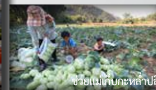
ช่วยแม่เก็บกะหล่ำปลี