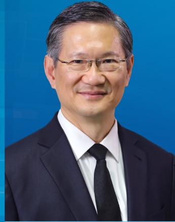
นายชาติศิริ โสภณพนิช กรรมการ